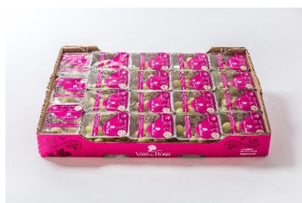
19 cuvetes de 150g